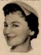
De Havilland, 1.7.

KREBS: Suchen Sie Verbündete, die ebenfalls Ihrer Ansicht sind. Sie werden Freunde brauchen, um sich durchzusetzen. Daß drei Menschen kräftiger am Seil ziehen können als Sie allein, ist doch klar.